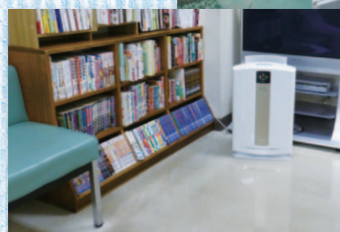
待合室にはダイキン加湿空気清浄機を設置