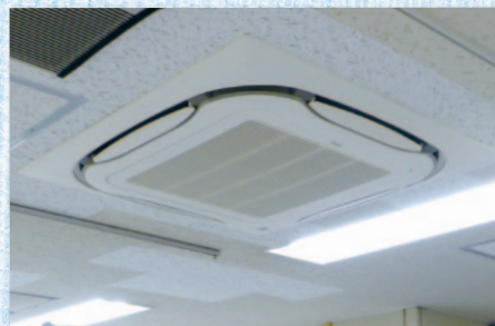
診察室の室内機には「ストリーマ除菌ユニット」も採用