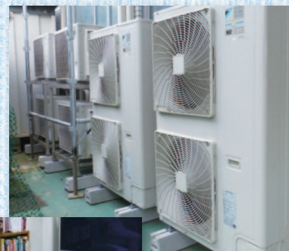
FIVE STAR ZEAS 室外機

※ 通常使用における故障に対する保証です。消耗品の交換や洗浄等の保守サービスは有償となります。