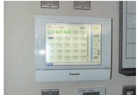
全館の空調を事務所に居ながら集中管理。