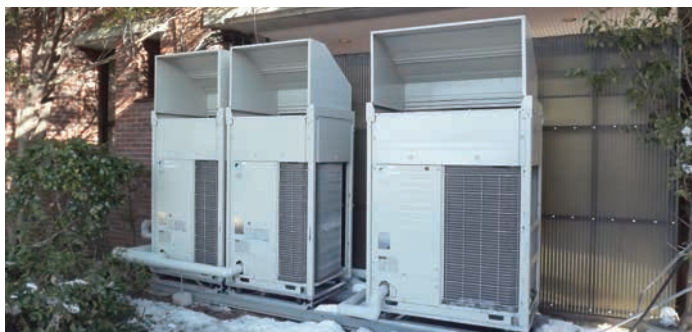
室外機は美観に配慮し、植え込みなどで囲われた場所などに設置。