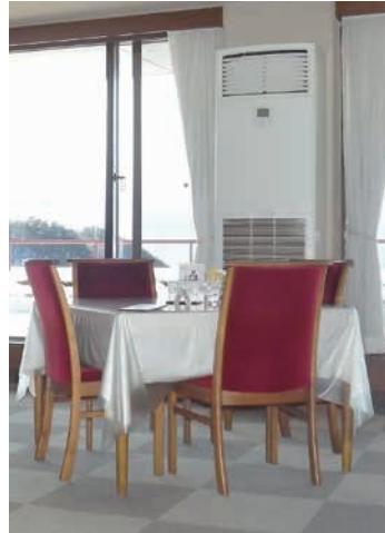
食堂や事務所、厨房など、運転時間や条件が全体と大きく異なる部屋はFIVE STARを中心に展開。