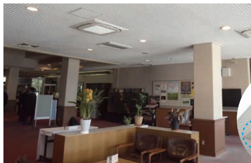
既存の吹出口などにセンシングフロータイプを多く配置して気流・温度ムラを改善。