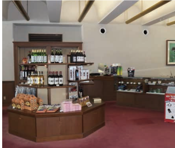
広いフロントロビーは既設の送風ダクトを利用して天井埋込ダクト形で空調。