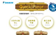
《クイックパイパー》